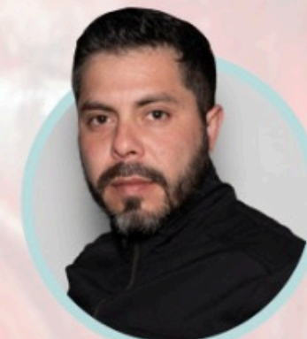
Lab. Diego Morales